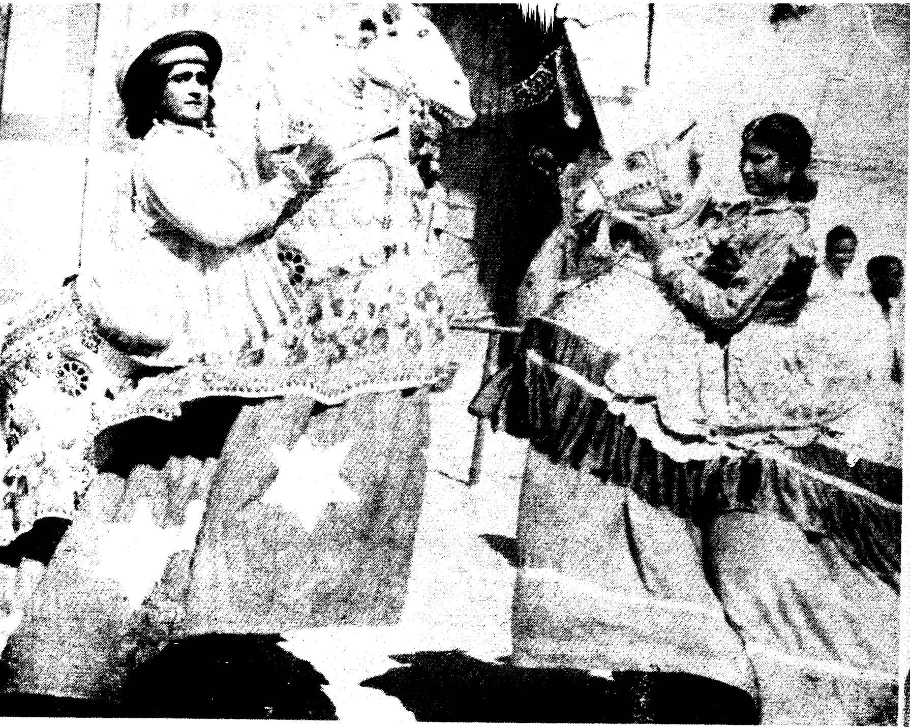
कृत्रिम घुड़सवार नृत्य